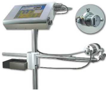
Impresora Ink Jet PD-18 (Opcional)